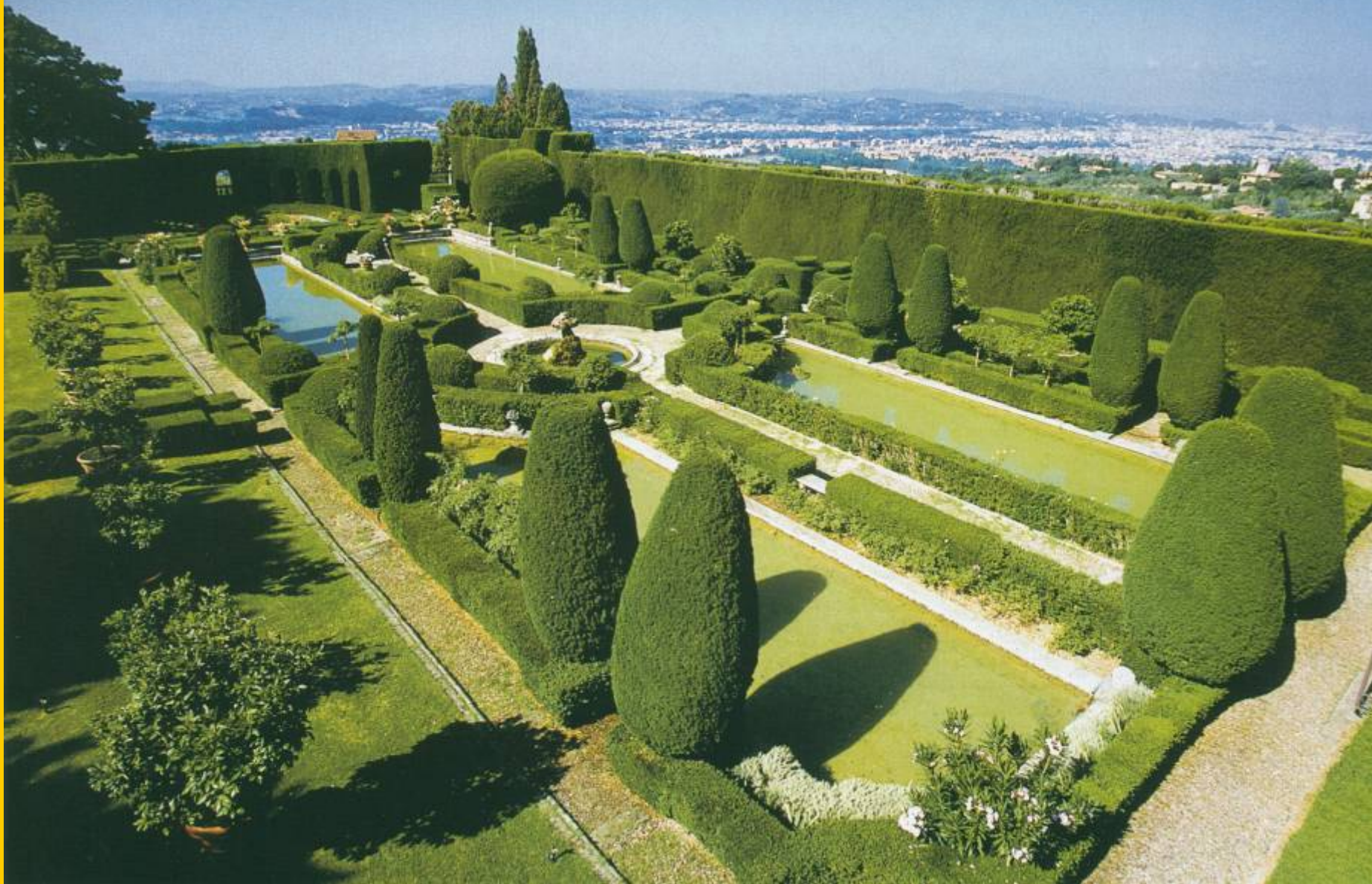
Флоренция. Средневековый регулярный парк